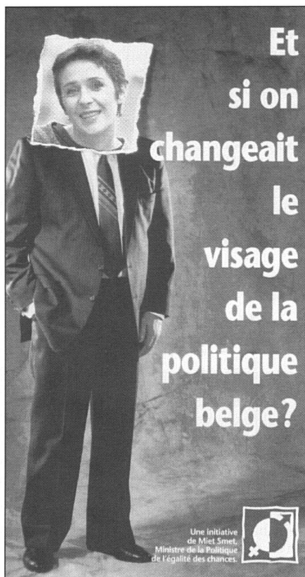
Affiche de la campagne en Belgique.