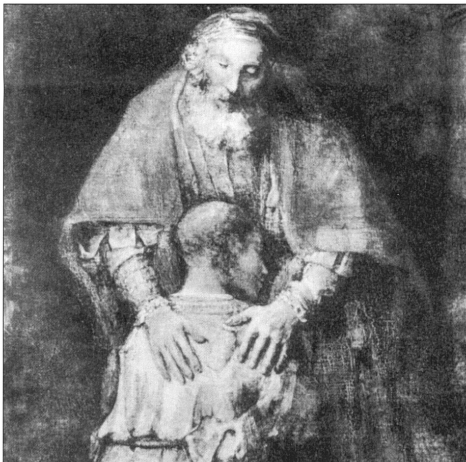
Dieu: une main de femme, une main d'homme.

Dans ces conditions, les femmes, responsables de la vie quotidienne, se trouvent plus que les hommes en prise directe avec le divin. Au reste, dans le bouddhisme tibétain, c'est le principe féminin qui est le principe actif. La «mère de tous les bouddhas» est l'origine de toutes les énergies. Il existe dans la tradition tibétaine des maîtres spirituels femmes, et les initiations féminines sont très prisées.