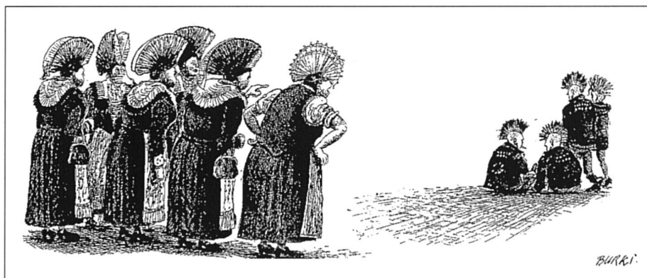
Des clivages dans le tissu social, politique et culturel de notre pays.

Pendant la campagne référendaire, il y a eu abondance d'information, mais manifestement déficit quant à la communication. FS a bien une vocation nationale. Malheureusement, il n'y a plus actuellement en Suisse alémanique de journal ayant une tendance analogue à la sienne avec lequel