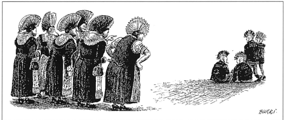
Des clivages dans le tissu social, politique et culturel de notre pays.

Pendant la campagne référendaire, il y a eu abondance d'information, mais manifestement déficit quant à la communication. FS a bien une vocation nationale. Malheureusement, il n'y a plus actuellement en Suisse alémanique de journal ayant une tendance analogue à la sienne avec lequel