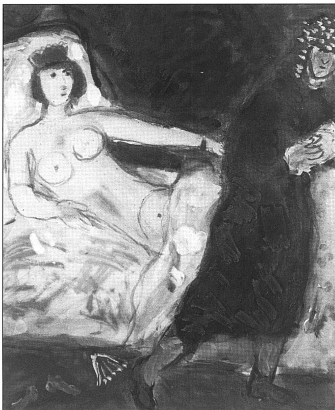
Joseph et la femme de Putiphar. Tableau de Marc Chagall.

Suzanne, chaste épouse d'un Juif riche, est poursuivie par les assiduités de deux vieillards qui se trouvent être des hommes nantis d'autorité dans la communauté, chargés de l'administration de la justice. Ceux-ci la menacent de la faire condamner pour adultère (avec un amant totalement imaginaire) si elle ne cède pas à leurs avances. Suzanne refuse malgré cette menace, et est effectivement condamnée à mort (face aux accusations des deux notables, elle n'a même pas le droit de se défendre), et n'est sauvée in extremis que par l'intervention du prophète Daniel.