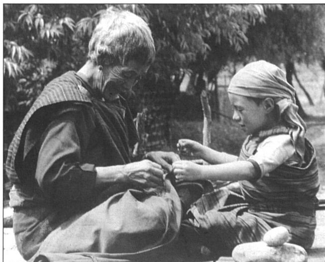
Grand-mère et petite-fille, la transmission d'un savoir culturel.

Le calendrier Helvetas ainsi que quantité d'autres articles - le catalogue général peut être obtenu gratuitement - sont à commander au (021) 323 33 73. Vente directe: av. de la Gare 38, 1001 Lausanne.