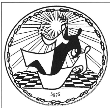
Emblème de la Grande Loge Féminine de Suisse.