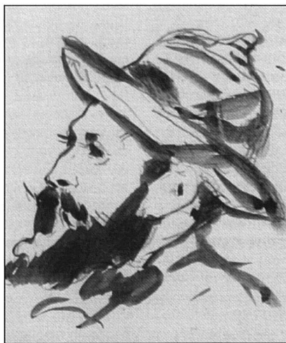
Edouard Manet, Portrait de Claude Monet (1874).