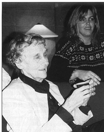
A l'occasion de ses 85 ans, dans une conférence de presse, Astrid Lindgren annonce qu'elle n'écrira plus.

Astrid Lindgren vient de recevoir à Vienne le Prix de l'UNESCO (Organisation de l'ONU pour l'éducation, la science et la culture).