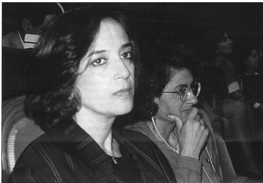
Pour les femmes algériennes, un avenir incertain.

Les sources historiques ont été tirées essentiellement de l'Agenda des femmes arabes, 1993, de Sakina Ballouz-Cherrad.