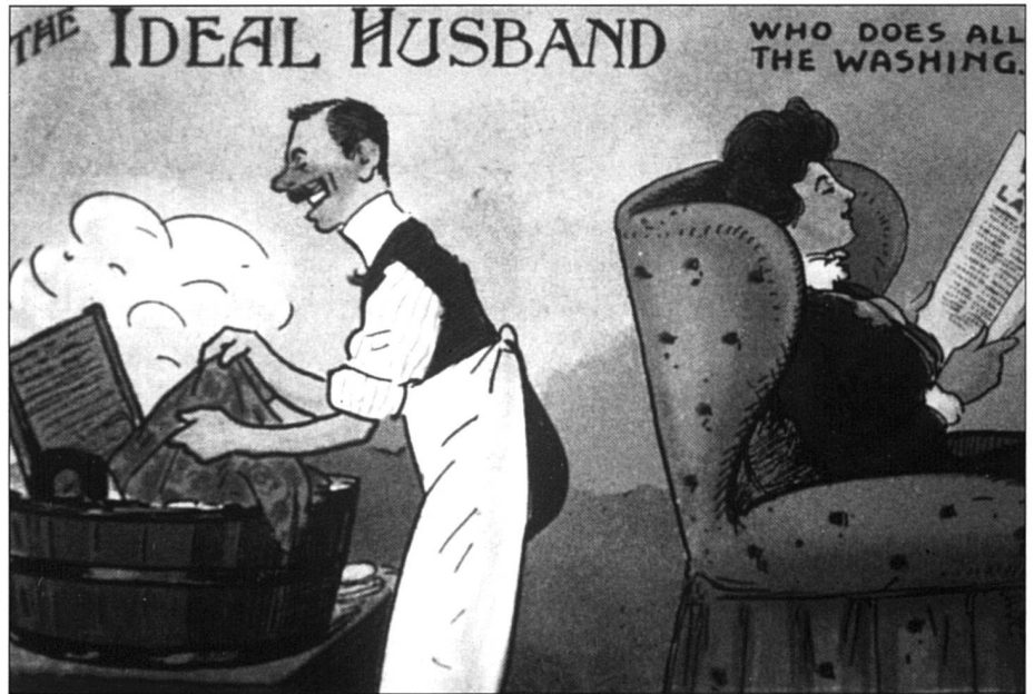
«Le mari idéal fait toute la lessive.» Au début du siècle, les suffragettes anglaises prêchaient déjà, à leur manière, le partage des tâches!

l'esclave de traditions familiales démodées, formant un frein à l'application de l'égalité. Et, je me suis posé la question de mes exigences quant au propre et au rangé... C'est là, je crois, un examen intéressant à faire avec d'autres, car il suscite discussions et réflexions parfois passionnantes et amusantes.