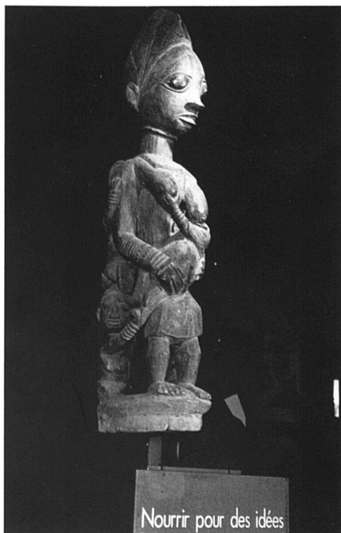
Nourrir pour des idées

Cette phrase ouvre l'exposition. Le ton est donné. Une fille est née. Elle sera femme, un rôle qui s'apprend dans toutes les civilisations. Chacune suit son chemin balisé dans l'exposition, comme dans la vie. La féminité est une affaire d'importance. Il y faut de l'ordre, car la survie de l'espèce en dépend. Voilà l'essentiel de la réflexion. Les visiteuses et les visiteurs sont invités à penser à leur conception du monde car c'est d'elle que découlent les représentations sociales et les rôles attribués au sexe. Il faut définir le féminin et le masculin, «convertir le langage du corps en un langage social». Partout les êtres sont confrontés à la vie, celle qui sort du ventre des femmes. Il y a là une force extraordinaire qu'il faut canaliser dans des pratiques ritualisées. Le pouvoir est en jeu et son exercice se fonde sur la distinction entre les sexes et sur des rapports rigides de hiérarchie. Les so-