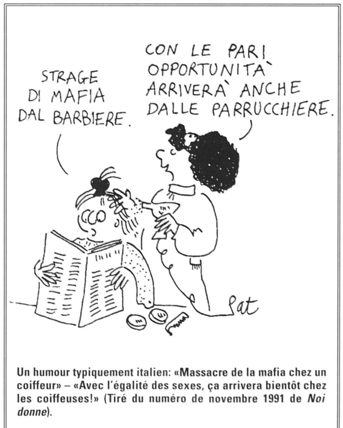
Un humour typiquement italien: «Massacre de la mafia chez un coiffeur» – «Avec l'égalité des sexes, ça arrivera bientôt chez les coiffeuses!» (Tiré du numéro de novembre 1991 de Noi donne ).