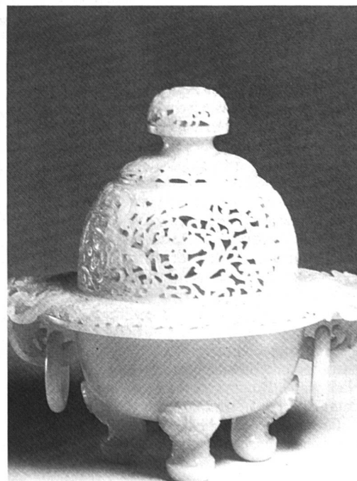
Ce brûle-parfum finement ciselé date du XVIII e siècle chinois. Il est en néphrite vert clair translucide. (Collections Baur, Genève)

L'exposition «Parure du Parfum» se tient au Musée de Carouge et aux Collections Baur jusqu'au 14 juin, tous les jours de 14 à 18 h, lundis exceptés.