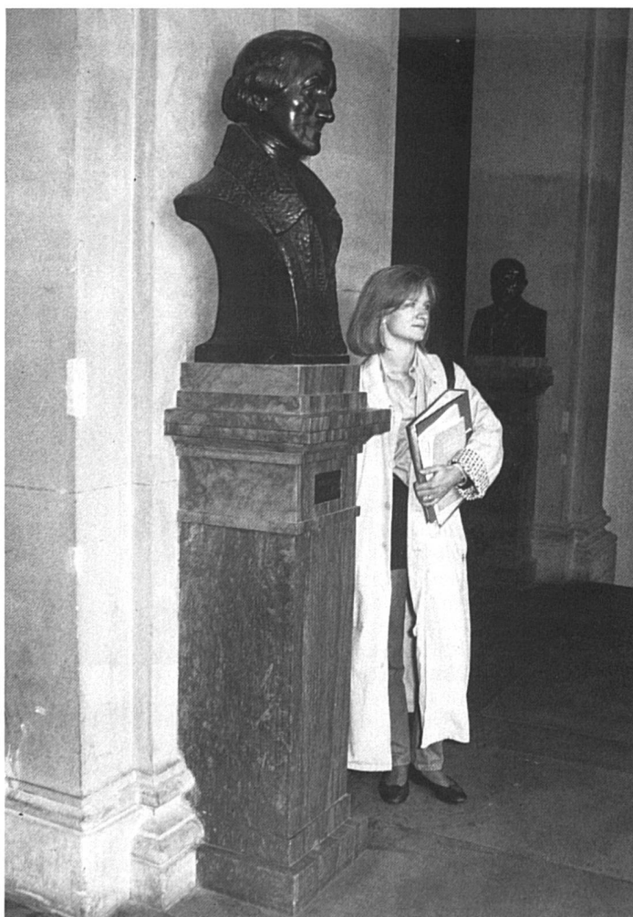
Le mariage aura-t-il finalement lieu entre la Suisse des «hommes en place» et celle des femmes en mouvement?