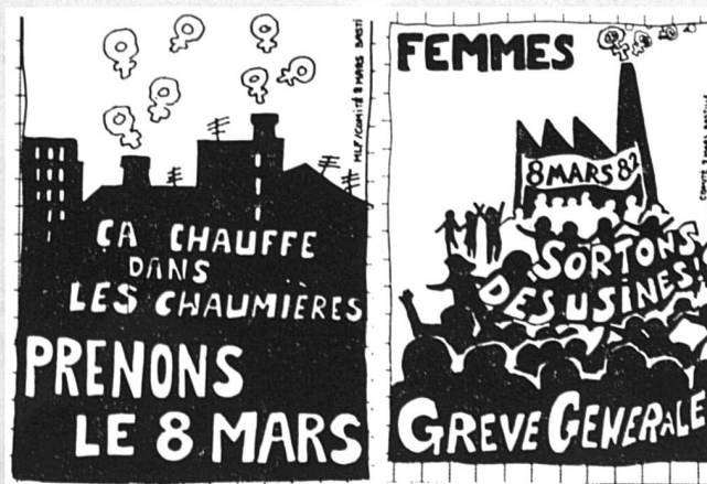
Des affiches MLF/France de 1982.

Toujours sur le thème des femmes réfugiées, et toujours le vendredi 8 mars, les Femmes pour la Paix et quinze autres organisations féminines genevoises organisent une soirée (dès 18 h 30) au Centre Camille Martin (1, rue Camille-Martin, angle av. d'Aïre) : accueil, rencontres, repas, musique, discussions.