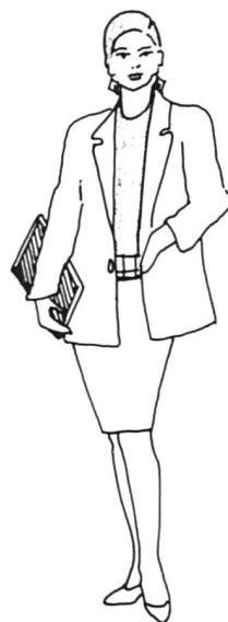
20 ans de suffrage féminin