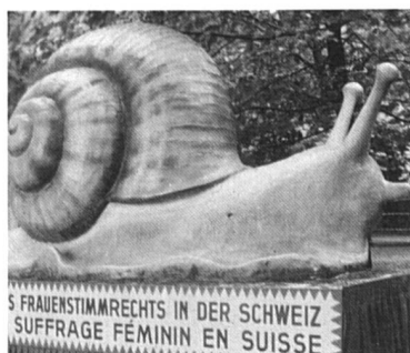
L'escargot du suffrage à la SAFFA de 1928.