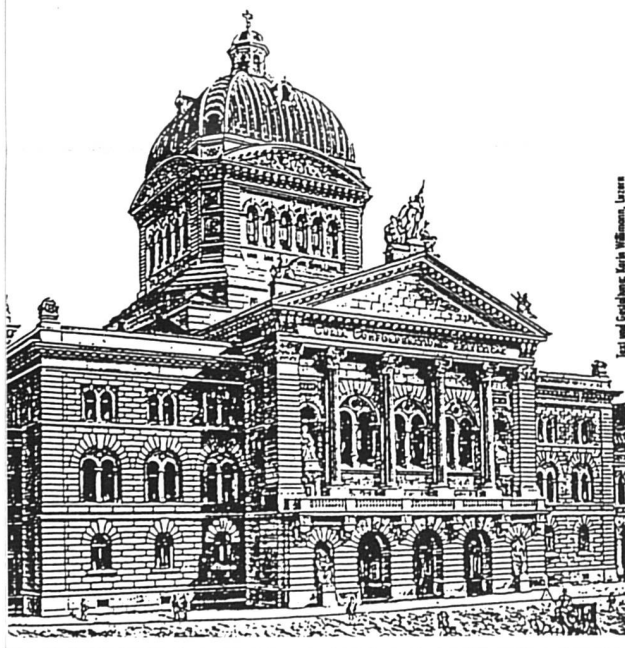
Il faudra encore attendre...