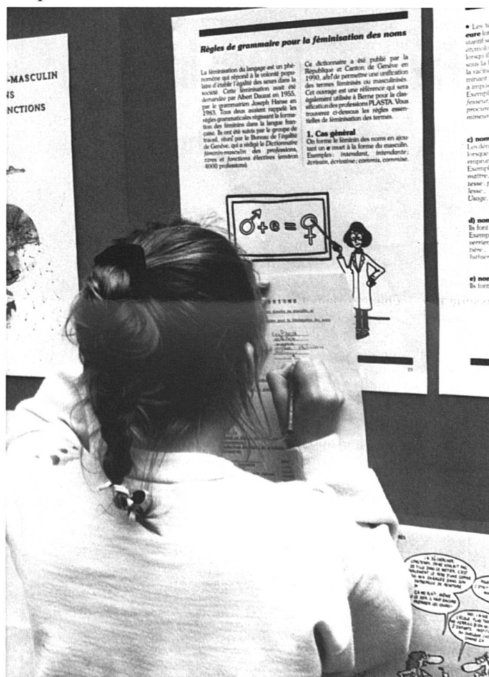
Cette photo de Philippe Maeder est tirée d'un album qui vient de paraître aux Editions d'En Bas, et qui réunit des textes et des photos témoignant de la portée de cette fameuse journée du 14 juin 1991. Mieux qu'un Rêve, une Grève , par Ursula Gaillard, 144 p., 100 photos et illustrations, Frs. 29.-, à commander aux Editions d'En Bas, case postale 304, 1000 Lausanne 17.

Les thèmes abordés étaient les suivants: – la loi sur l'égalité: le Conseil fédéral promet son achèvement pour 1992. L'USS qualifie le projet de «relativement bon», tout en déplorant avoir dû l'attendre dix ans; – la 10 e révision de l'AVS: le flou. F. Cotti aurait reconnu que son idée d'une