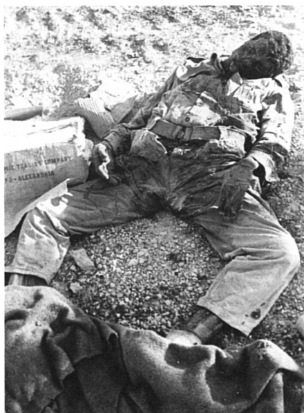
Guerre des Six Jours, juin 1967, dans le Sinaï: «Que de sentiment ma chère!»

Ce à quoi une Tunisienne répondit: «Pour moi aussi la guerre du Golfe a été un révélateur et non seulement du pouvoir absolu de la parole masculine. J'avais oublié le racisme latent, les bases viciées des relations entre l'Europe et ses anciennes