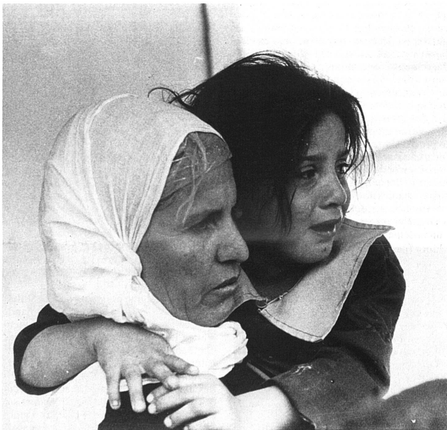
Guerre civile au Liban. Réfugiés palestiniens de camp de Saint-Simon. Beyrouth, Liban, 1976. Document CICR/DICA, Genève. (Photo Jean-Jacques Kunz)

En principe, donc, l'enfant est doublement protégé: en tant que personne ne participant pas, sauf exception, aux hostilités, et en tant qu'être «particulièrement vulné-