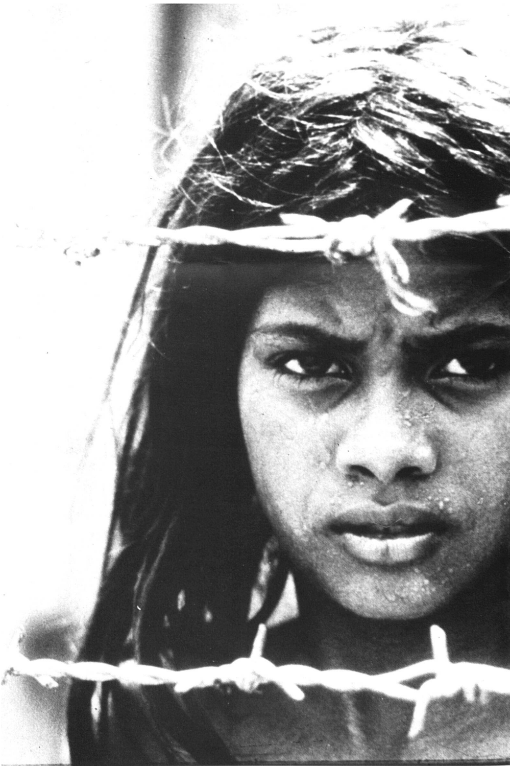
Guerre indo-pakistanaise. Enfant. Pakistan, 1971. Document CICR/DICA, Genève. (Photo André Jolliet)

D'autres instantanés de la guerre vue de l'enfance: ces bébés qu'une cloche «protégeait» contre les bombardements chimiques qui menacèrent Israël pendant la guerre du Golfe. Mais a-t-on parlé de ceux qui étaient trop grands pour le berceau protégé et cependant trop petits pour le masque à gaz? Devaient-ils mourir suffoqués sous le regard de leurs parents?