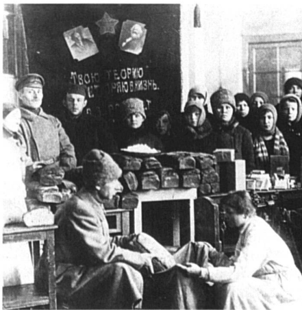
Révolution russe et guerre civile. Distribution de pain. Russie, 1917.

Les dispositions pour la protection et l'assistance aux enfants tendent en priorité à maintenir ou reconstituer les liens des familles dispersées par la guerre ou l'exode.