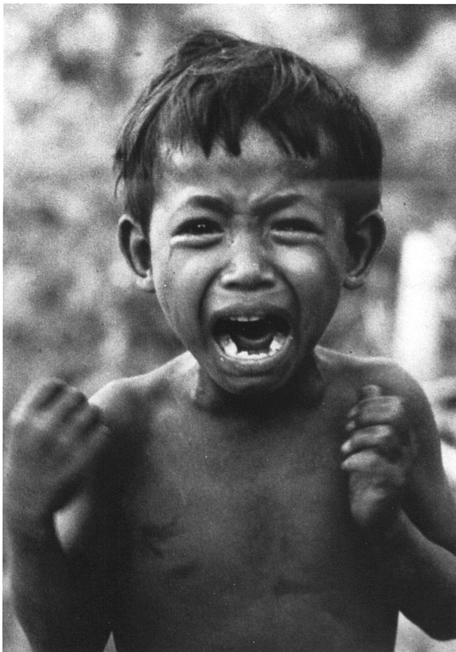
Guerre civile au Kampuchéa. Orphelin. Battambang, Kampuchéa, 1980. Document CICR/DICA, Genève. (Photo G. Leblanc)

Le droit international humanitaire en faveur des enfants se développe, mais reste un instrument insuffisant.