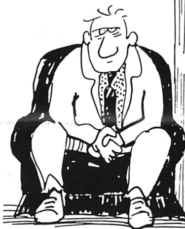
Comme le travail bénévole : ça ne s'achète pas...

– les deux premiers cherchent à connaître la nature et la quantité de travail bénévole effectué l'année passée ;