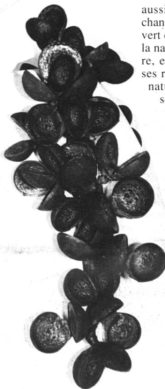
Sculpture: Siporex, éléments végétaux (Australie), 65cm x 45cm.