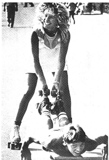
Etre bien dans sa peau...

(ib) – Répondant à l'appel du Centre de liaison, les Neuchâteloises des diverses sociétés et associations se réunissent traditionnellement une fois l'an. Le