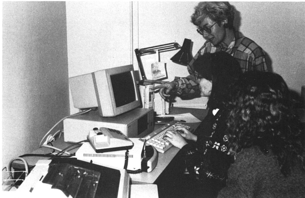
Maîtriser les nouvelles technologies.

La fonction première des bibliothécaires devient ainsi celle de médiateur entre les documents et les besoins des usagers. Dans le nouveau plan d'études, des cours de commu-