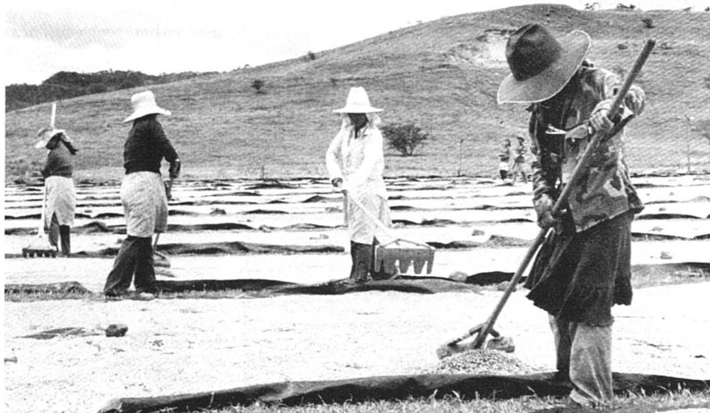
Séchage du café dans la région de Matagalpa. Photo de Rob Brouwer tirée du livre « Un peuple, une Passion » (Ed. de la Thièle), de Chantal Bianchi.

que femme différente de celle que je souhaite. En effet, la situation de la femme dans la famille est en contradiction avec la loi qui prône l'égalité