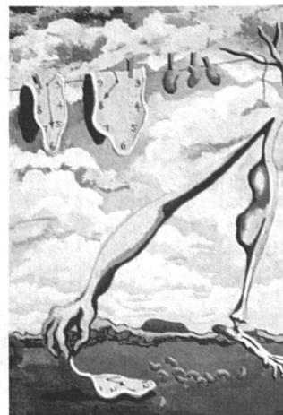
Mme Dali étend son linge.