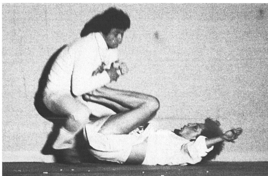
Une relation de couple, ça se soigne.

Une étude choc le montre : les délits sexuels ne sont que la manifestation plus spectaculaire de la prédominance masculine dans la société.