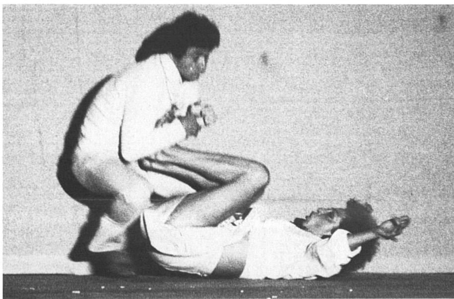
Une relation de couple, ça se soigne.

Une étude choc le montre : les délits sexuels ne sont que la manifestation plus spectaculaire de la prédominance masculine dans la société.