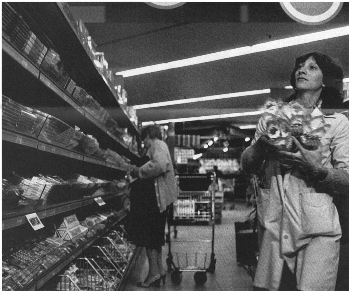
Vendeuse dans un supermarché : un budget précaire.