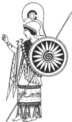
Athéna ou Minerve, déesse de la sagesse, des arts domestiques et de l'artisanat.

Ces ouvrages peuvent être obtenus à F-Information, case postale 757, 1211 Genève 3, tél. (022) 21 28 28.