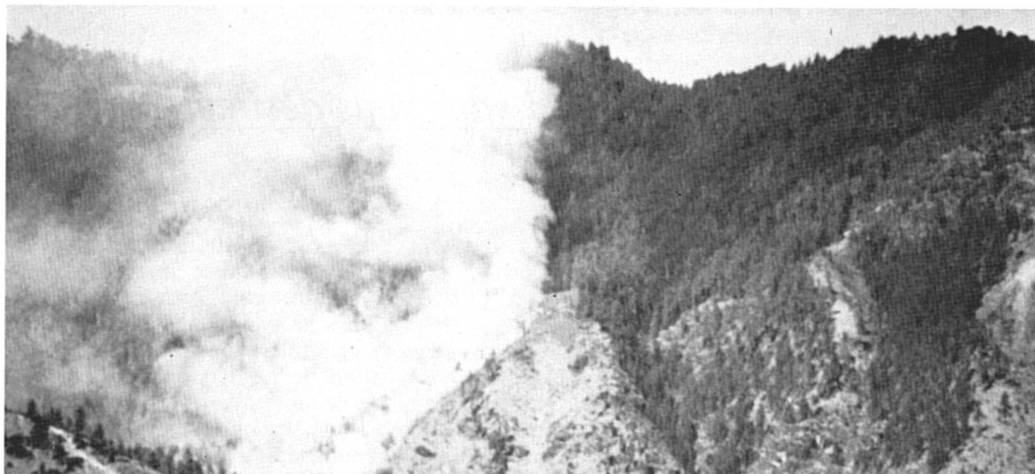
Une banque préoccupée par les questions d'environnement. Sur cette photo Helvetas : destruction de la forêt par le feu au Bhoutan.

En Suisse, « l'appel de Bâle », qui groupait quelque 600 personnes des milieux de gauche et écologistes, a demandé le 16 novembre 1988 l'interdiction de la plupart des recherches et de l'application, même médicale, de la technologie génétique.