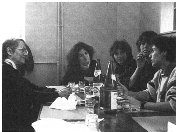
En conversation avec des féministes suisses.

« Si vous êtes féministe, vous êtes forcément antimilitariste. Si vous êtes antimilitariste, vous êtes forcément féministe. » C'est le message qu'a tenté de faire passer Andrée Michel lors de son passage à Bienne, invitée par F-Info à l'occasion de la Journée internationale de la femme.