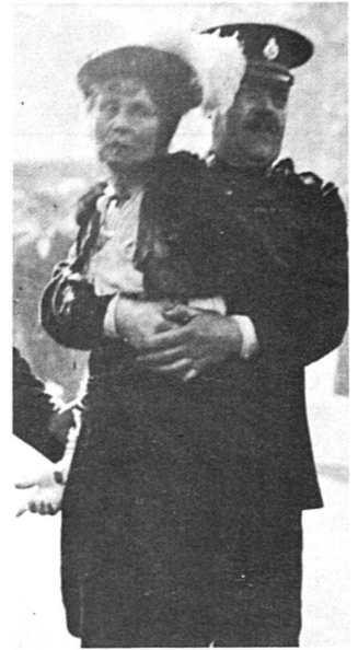
Arrestation d'une suffragette à l'époque glorieuse du suffragisme anglais. Les Appenzelloises sont plus patientes...

Le fait que la garantie fédérale ait été accordée aux constitutions appenzelloises, n'est pas déterminant. On sait que le Tribunal fédéral n'a pas voulu autrefois introduire le suffrage féminin par un jugement, considérant la question comme trop importante et donc relevant du législateur. Mais il ne