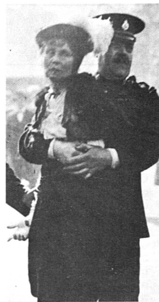
Arrestation d'une suffragette à l'époque glorieuse du suffragisme anglais. Les Appenzelloises sont plus patientes...

Le fait que la garantie fédérale ait été accordée aux constitutions appenzelloises, n'est pas déterminant. On sait que le Tribunal fédéral n'a pas voulu autrefois introduire le suffrage féminin par un jugement, considérant la question comme trop importante et donc relevant du législateur. Mais il ne