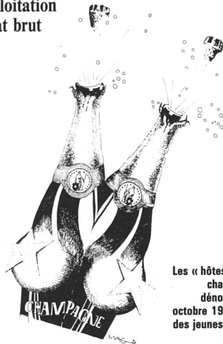
Les « hôtesse » des bars à champagne, dont FS dénonçait les abus en octobre 1984, sont souvent des jeunes femmes du tiers monde.