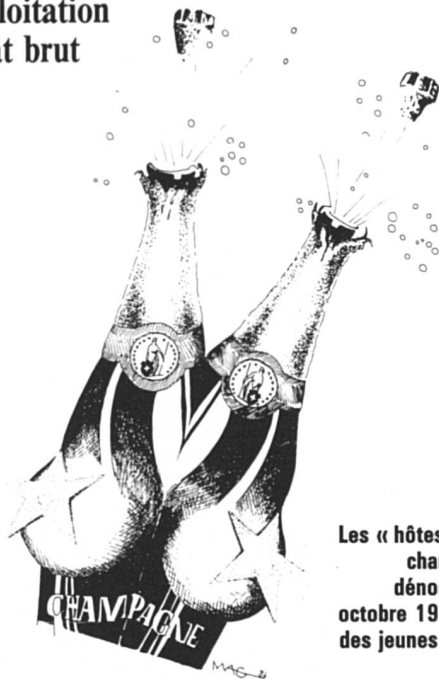
Les « hôtesse » des bars à champagne, dont FS dénonçait les abus en octobre 1984, sont souvent des jeunes femmes du tiers monde.