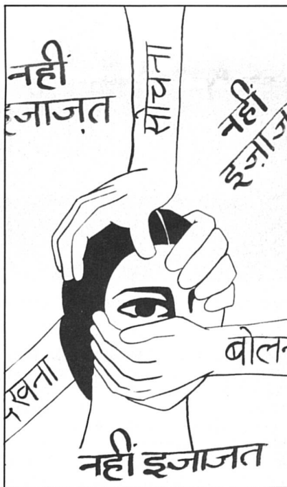
Dessin tiré du bulletin d'Isis.

Une histoire abracadabrante qui devient quotidienne, comme le prouve l'augmentation du nombre de femmes dans les geôles pakistanaïses : 70 en 1980, elles sont 1500 aujourd'hui. Le