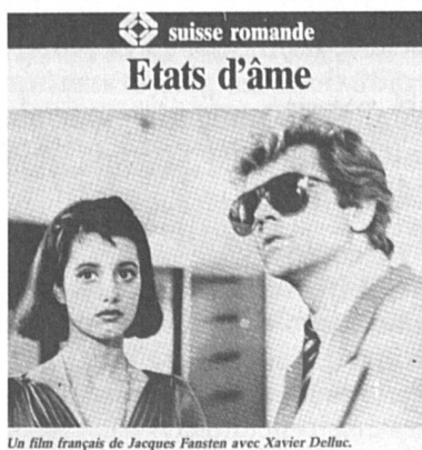
Un film français de Jacques Fansten avec Xavier Delluc.

« Regardez les légendes de ces deux photos parues dans la page « Télévision » de la Tribune de Genève : à mettre dans la catégorie femme-potiche, femme invisible ou femme sans nom ? »