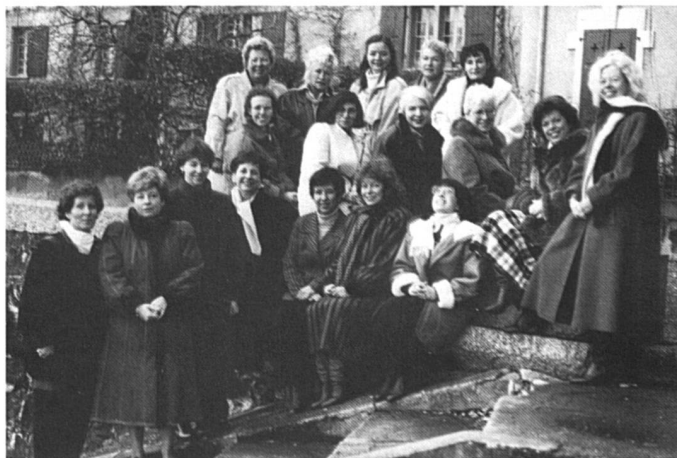
Vingt-quatre femmes de la région du Lavaux (il n'en manque que quelques-unes sur la photo !), venues de tous les horizons professionnels ont fondé au mois de mars un nouveau Club soroptimiste romand.

(1) 18, avenue du Condal-Mermillod, 1227 Carrouge, téléphone (022) 43 22 33.