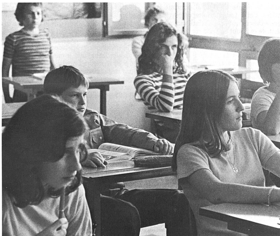
Ecoutez bien, les enfants... autant de gagné pour maman à l'heure des leçons !

« Lorsque mon fils était en 4e primaire, raconte une mère valaisanne, il avait de la peine et récoltait punition sur punition. Je précise qu'il ne s'agissait pas de questions de discipline, mais bien d'une difficulté à suivre la classe. La tension était devenue si