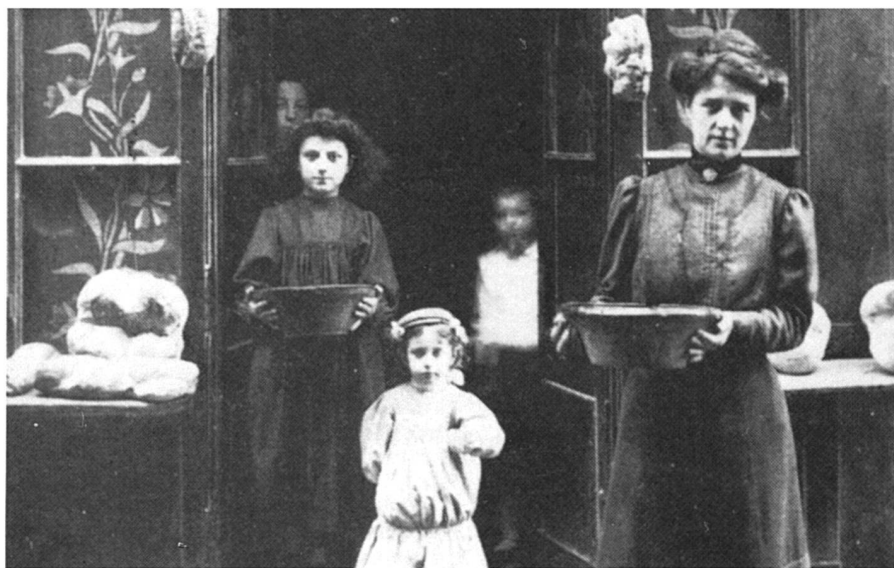
Photo illustrant la couverture du livre «Les femmes, le travail et la famille».