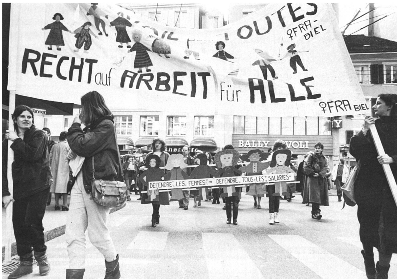
Droit au travail pour toutes... mais quel travail ?