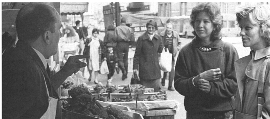
Nourrir sainement la famille (gare aux nitrates dans les salades !) : encore une tâche pour les femmes.

Une meilleure connaissance des fonctions reproductrices de la femme, la découverte de la pilule contraceptive ont profondément modifié le comportement sexuel des femmes. Elles sont devenues maîtresses de leur corps, mais cela signifie aussi qu'elles peuvent plus ou moins s'adapter à leur rôle de travailleuse. C'est d'ailleurs, ce que demandent certains patrons aujourd'hui, lorsqu'ils engagent des femmes cadres. Ils proposent un cursus professionnel ascendant... mais pas d'enfant, ou si la femme est célibataire... pas de mariage ! (sic, entendu dans une grande banque.) Alors, maîtriser sa fécondité sert à qui ? A quoi ?