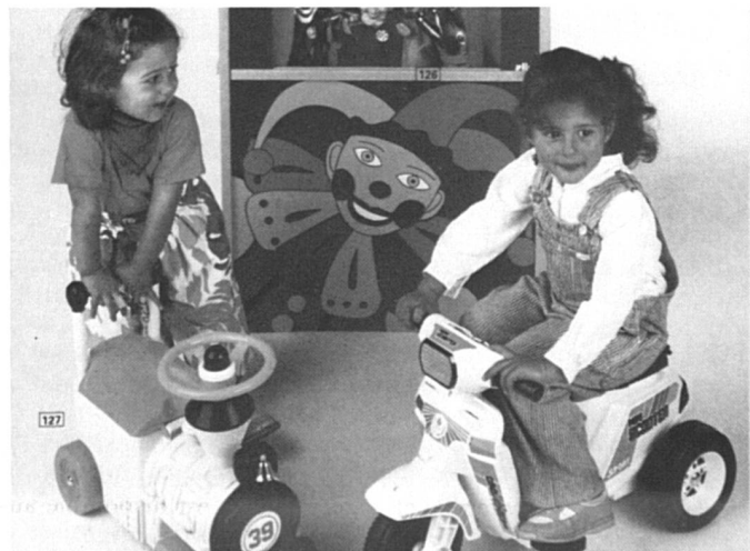
Des jouets pour le développement et le plaisir.