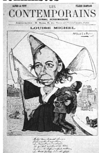
Louise Michel, « la nonne rouge », caricature de 1880.

La Bibliothèque Marguerite Durand, à Paris, édite une série de 7 cartes postales reproduisant des documents anciens appartenant à ses collections. Voilà qui va faire plaisir aux collectionneuses de documents relatifs à l'histoire des femmes. Ces cartes peuvent être commandées à l'Agence culturelle de Paris, 6, rue François-Miron, 75004 Paris. (Prix : FF 2.50 la pièce).