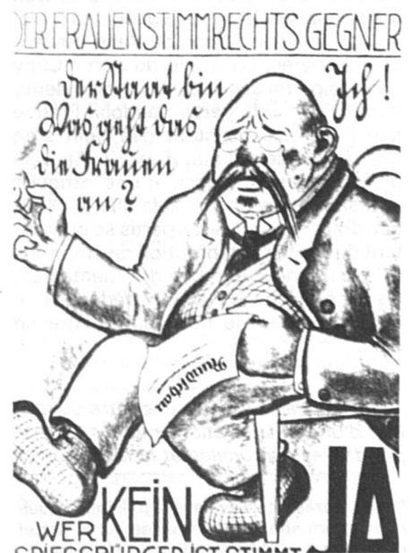
Affiche du Parti socialiste bâlois, 1920. Satire de l'opposant au suffrage féminin.

Le raisonnement ne fait pas un pli... à ceci près que, dans la plupart des cas, les quotas en faveur des hommes ne sont consignés nulle part (ils s'imposent hélas d'eux-mêmes) alors que les quotas en faveur des femmes exigent une codification stricte pour être respectés. Sur le plan des principes, cette asymétrie est choquante ; mais, rétorquent les partisans du système des quotas, quel autre moyen avons-nous à disposition pour corriger l'asymétrie, bien réelle, et