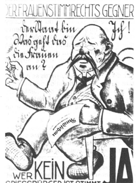
Affiche du Parti socialiste bâlois, 1920. Satire de l'opposant au suffrage féminin.

Le raisonnement ne fait pas un pli... à ceci près que, dans la plupart des cas, les quotas en faveur des hommes ne sont consignés nulle part (ils s'imposent hélas d'eux-mêmes) alors que les quotas en faveur des femmes exigent une codification stricte pour être respectés. Sur le plan des principes, cette asymétrie est choquante ; mais, rétorquent les partisans du système des quotas, quel autre moyen avons-nous à disposition pour corriger l'asymétrie, bien réelle, et