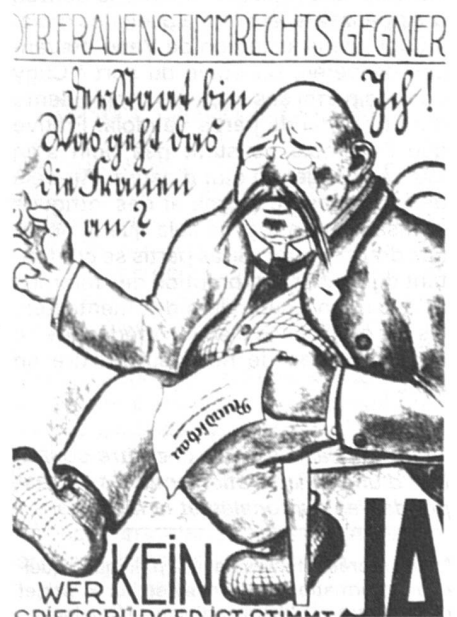
Affiche du Parti socialiste bâlois, 1920. Satire de l'opposant au suffrage féminin.

Le raisonnement ne fait pas un pli... à ceci près que, dans la plupart des cas, les quotas en faveur des hommes ne sont consignés nulle part (ils s'imposent hélas d'eux-mêmes) alors que les quotas en faveur des femmes exigent une codification stricte pour être respectés. Sur le plan des principes, cette asymétrie est choquante ; mais, rétorquent les partisans du système des quotas, quel autre moyen avons-nous à disposition pour corriger l'asymétrie, bien réelle, et