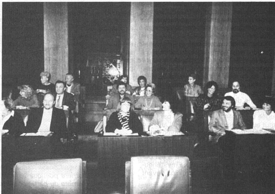
Le groupe des députés socialistes dans la salle du Grand Conseil genevois, en décembre 1986 : 11 femmes et 7 hommes (un homme malade ne figure pas sur la photo). L'exception qui confirme la règle !

Le cas du canton de Vaud, enfin, est exemplaire. Aux élections cantonales de