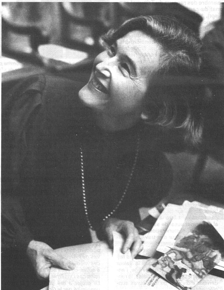
Elisabeth Kopp le jour de son élection au Conseil fédéral. A l'exécutif fédéral, la représentation féminine atteint 14 % et des poussières...

une recherche actuellement en cours à l'Institut de sociologie de l'Université de Zurich, et dont les premiers résultats ont été publiés récemment*, les femmes détenaient en juin 1985, 3 828 mandats dans les institutions politiques suisses (aux niveaux communal, cantonal et fé-