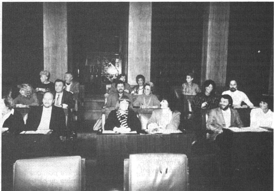
Le groupe des députés socialistes dans la salle du Grand Conseil genevois, en décembre 1986 : 11 femmes et 7 hommes (un homme malade ne figure pas sur la photo). L'exception qui confirme la règle !

Le cas du canton de Vaud, enfin, est exemplaire. Aux élections cantonales de