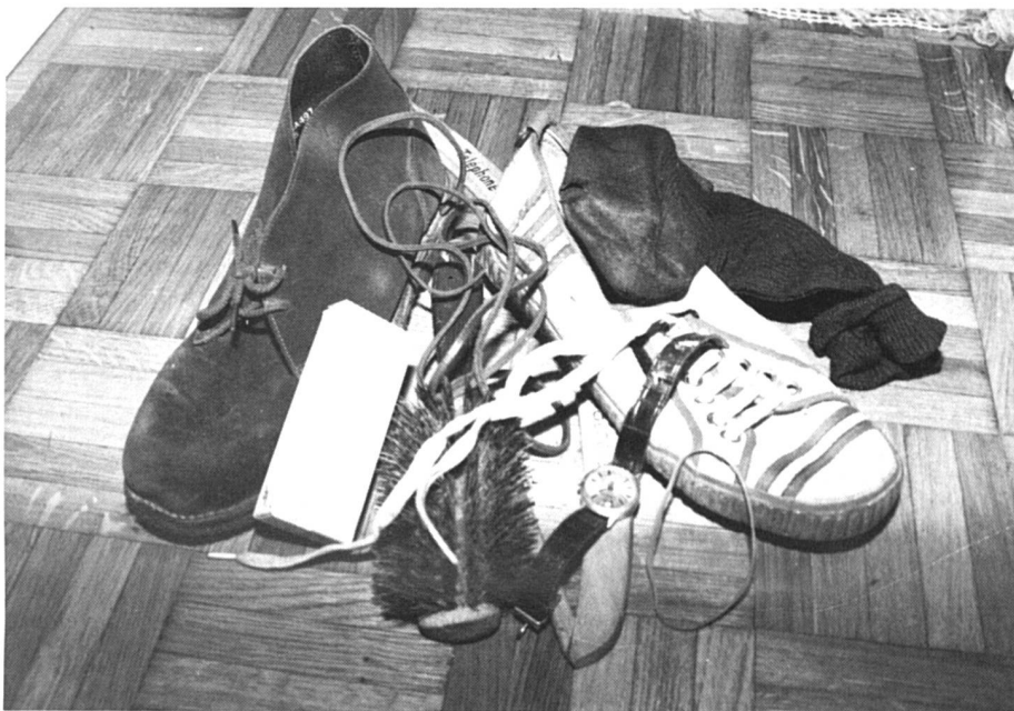
A chacun son bien.

Dans le nouveau droit matrimonial, chacun des époux sera donc créancier envers son conjoint de la moitié du bénéfice réalisé par ce dernier durant le mariage. Cette créance peut toutefois être compro-