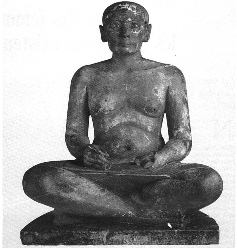
Le scribe égyptien.

● Le legs est l'attribution d'une somme, d'un bien (mobilier ou immobilier) ou