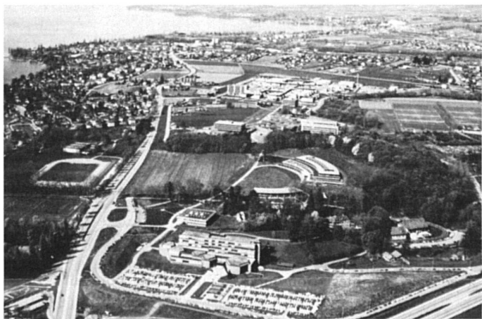
L'Université de Lausanne, à Dorigny.

De plus, de doctes esprits se sont inquiétés que le MIH ne soit qu'un instrument au service de l'ambition personnelle de la