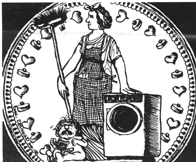
Dessin de Pierre Reymond, tiré de la brochure « La ménagère, une travailleuse », éditée par le Collège du Travail.

Les déléguées, quant à elles, ont fait observer que, même si le travail ménager est fait de sentiments et d'amour, même s'il est inestimable, comme le qualifie le Conseil d'Etat, il arrive dans la vie d'une personne des circonstances où ce travail ménager doit être évalué monétairement : accident mortel, invalidité, maladie, divorce, etc. Devant les tribunaux, lorsqu'on doit évaluer la valeur d'un dommage, d'un travail accompli, on fait réguliè-