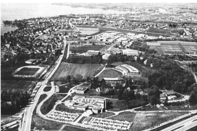
L'Université de Lausanne, à Dorigny.