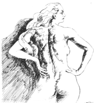
Dessin MS janvier 1981.

« Rosa Canina » continue le travail, mais les sept « licenciées » ont lancé un appel pour recréer une alternative aux accouchements hospitaliers.