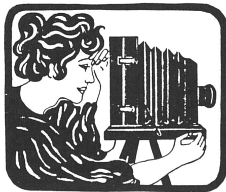
Women's International Bulletin 27.

Aujourd'hui, on est loin du film militant qui embarquait les femmes vers des lendemains meilleurs, comme ce film d'Agnès Varda, « L'une chante, l'autre pas » de 1968, ou ce film bouleversant de Chantal Ackerman sur l'enfermement, la vie d'une femme pendant trois jours dans sa cuisine, « Jeanne Dielman », de 1975. On était alors dans les années de dénonciation, les années de revendication. En 1987, les films de fiction sont concentrés sur des biographies de femmes, des souvenirs d'enfance autobiographiques, des sujets de fiction qui ne mettent pas uniquement des femmes en scène, mais dans lesquels on trouve souvent une revendication politique commune aux deux sexes, une mise en accusation de la société dans son ensemble. Seuls les films qui ont pour sujet les lesbiennes,