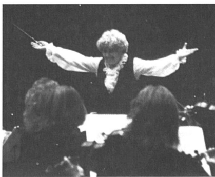
Photo du film « Les femmes chefs d'orchestre », de Christine Olofson.

Dès les premières images du film, on travaille, on peine, on s'essouffle, on s'identifie à la passion de ces six femmes (américaines, suédoises, norvégienne et