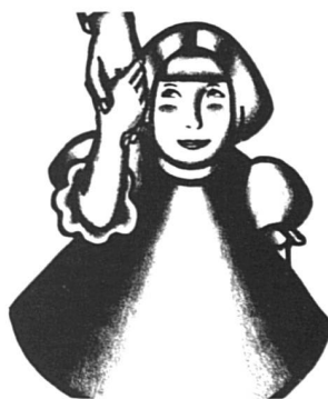
Pour éviter à d'autres enfants la souffrance de la séparation. Dessin Ms/31

A l'heure où vous lisez ces lignes, vous avez sans doute déjà vu leurs photos dans la presse quotidienne : cinq mères d'enfants franco-algériens enlevés par leur père algérien